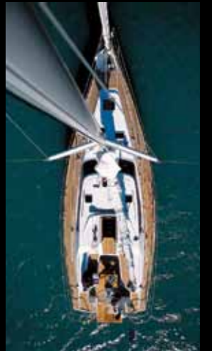
PILOT SALOON 48