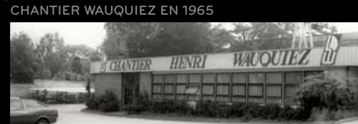
CHANTIER WAUQUIEZ EN 1965